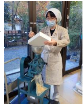
生薬を粉砕する様子

かつては大黄(タデ科 Rheum 属の根茎)や附子(キンボウゲ科 Aconitum 属の塊根を修治したもの)など、作用の強い生薬が使われていたが、時代が下るにつれてこれらを除いた処方を用いられるようになったとされる。