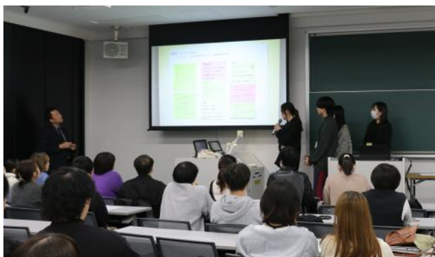
学科混成グループでのプロダクト発表

実際に研修会を行ってみると、I部では同じ教育を受けているため議論がスムーズに進みましたが、II部では各専門の医療人教育を受けてきているため、それぞれの立場からの考え方の違いが明確になり、それぞれの意見をうまく統合させた共通のアウトカムを導き出すのに苦労している様子でした。しかし、研修終了後の薬学生からは「同じシナリオであるにも関わらず、着眼点が異なり、普段では思いつかない視点があることに気づかされた」や「他分野の専門用語を理解しながらの議論は難しく、患者の生きがいを探る重要性を共有できたのが成果でした」という意見が上がっていました。