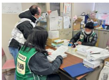
災害支援活動後の報告書作成

まず一つ目として「自動化に頼り過ぎないこと」です。近年、AI化が進み、医療においてもDXに移行する流れは言うまでもありませんが、いざ災害が発生すると電気・ガス・上下水道等のライフラインが切断されるため