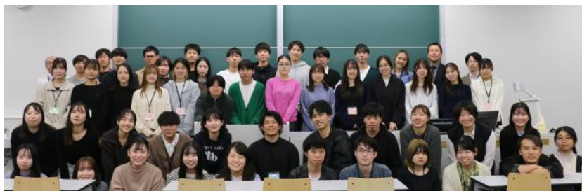
研修会参加者の皆さん

日本は世界に類を見ない少子高齢化を迎えています。社会保障費も膨れ上がってきており、これからの地域医療は“病院完結型医療”から“地域連携型医療”にシフトしないとはいけません。これに対応するためには、治療（cure）だけでは不十分であり、発症後の介護・福祉も含めたケア（care）も重要になります。そのため、自らの専門的能力だけではなく、他職種の役割を理解した上で、多様な専門職と協働し、患者や利用者のニーズに応じていく実践的な能力を身に付け、医療現場で働き始めた時から円滑なチーム医療を実践できるように学生時代から多職種連携についてしっかりと理解しておくことが重要であり、非常に大切な研修会であると考えています。