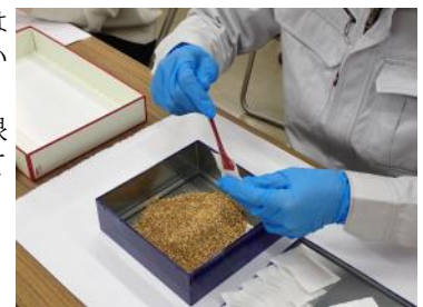
配合した生薬を袋詰めしています