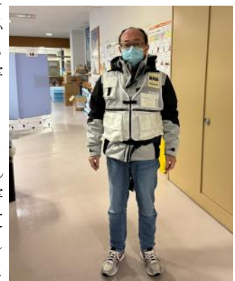
災害支援活動の服装

最後に、今回被災地を訪れて薬剤師や医療人ではなく、一人の人間として「自分たちが今普通に生活が出来ている有難さ」を認識するとともに、いざ災害が発生すると「当たり前が当たり前でなくなる」ことを改めて実感しました。災害支援は体力も必要ですし、様々な能力も必要になりますが、災害支援を経験することで自分自身の視野が広がると思います。薬学生の皆さんが将来薬剤師になられたとき、もし大きな災害等があった際には災害支援活動に積極的に参加していただけたらと思います。