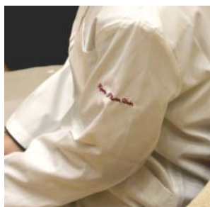
新しくなったデザイン

学生に授与した白衣は、教育後援会と京薬会からのご支援によるものです。今回、白衣のデザインが一新され、左腕上腕部に大学名（Kyoto Pharm. Univ.）を刺繍、しわになりにくい生地となっています。