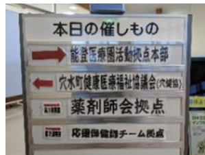
穴水災害拠点本部の入り口

穴水地区はある程度災害復興が進んでいるため、私が派遣された時期は地域の保険診療に戻す方向での災害支援活動がメインでした。そのため、薬剤師としての災害支援活動として、①DMATやJMATとの帯同、②避難所の環境・衛生管理、③避難所生活をされている被災者のみなさんの体調チェックや服薬管理状況の確認、④発行された災害時処方箋によりモバイルファーマシーで調剤された医薬品の配達、などが主な活動でした。まだまだインフラ整備が不十分であり、特に上下水道が復旧していないことから、飲み水やトイレなどの生活面において非常に大変だと感じました。道路等も徐々に整備されつつあるものの片側一方通行のところも多く、また家が壊れた状態で放置されている場所などもあり、通常の日常生活に戻るまでまだまだ時間を要する状態でした。