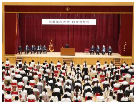
真新しい白衣に袖を通し、心構え新たに

最後に学生の代表から「愛学躬行の精神を心に抱き、本学の学生らしい意欲と態度で実習に臨む」との誓いの言葉が述べられ、閉式となりました。