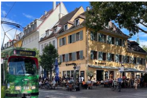
大学周辺の街の様子

フライブルクはドイツ南西部に位置する自然豊かな学生街です。街には石畳の道が続き、パステルカラーの家や建物が続く街並みは、まるで絵本の中の世界のようなものでした。市内にはトラム(路面電車)が張り巡らされ、移動が非常に便利でした。また、景観まちづくりやゴミの分別制度が整っており、環境に対する意識の高さを感じました。1日の気温差が15℃と激しく、服装選びが難しかったです。夜は21時頃まで日が出ており、比較的安全な環境の中で留学生活を送ることができました。