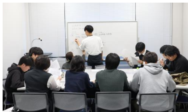
I部で実施した学科ごとのSGD

本年度の研修会に参加した学生は48名（京都薬科大学：5年次生12名、京都橘大学看護学部：4年次生12名、京都橘大学健康科学部理学療法学科：4年次生12名、京都橘大学健康科学部作業療法学科：4年次生12名）でした。