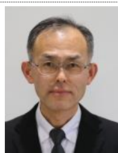
生命薬科学系 公衆衛生学分野