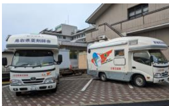
モバイルファーマシー

今回、日本薬剤師会の災害支援業務の派遣で1月22日～26日に京都府薬剤師会の第二陣として石川県の穴水地区へ行ってきました。能登半島地震の災害拠点は穴水地区以外に門前地区、能登地区、輪島地区、珠洲地区の5拠点が、中でも珠洲地区が最も被害が大きい地区ですが、私が行った穴水地区は珠洲地区と比較すると被害が小さいものの、まだまだインフラ整備が不十分なところがある場所でした。