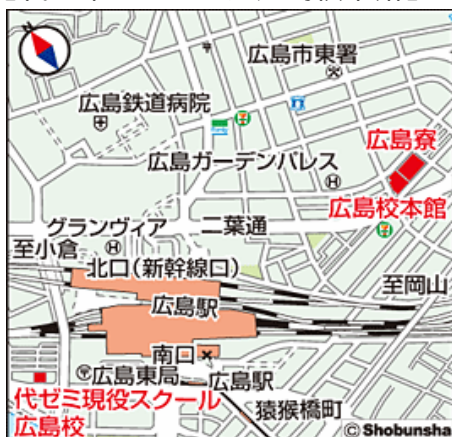
【代々木ゼミナール広島校本館】