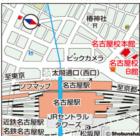
【代々木ゼミナール名古屋校本館】