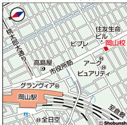
【代々木ゼミナール岡山校】