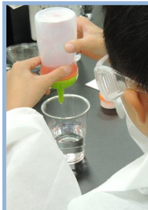
水溶液の中に人工イクラが・・・