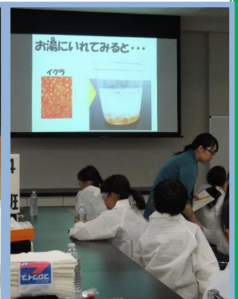
写真を使って実験の説明を