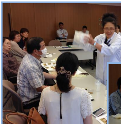
6月9日予備実験をして薬科大学の先生と実験内容の打合せをしました。