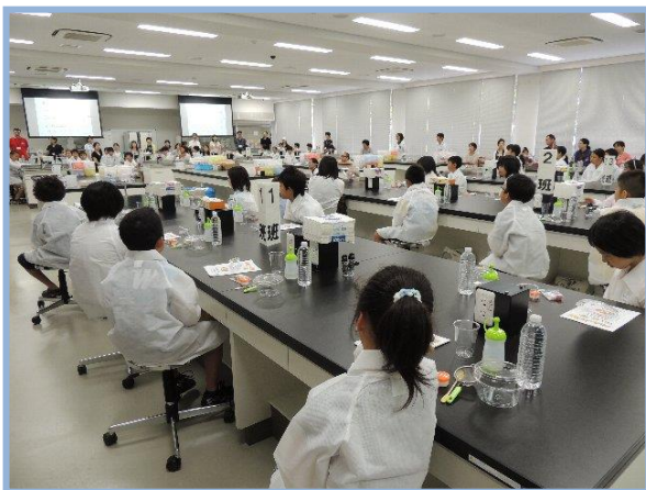
本格的な大学の実験教室で白衣を着ながら真剣に話を聞く児童