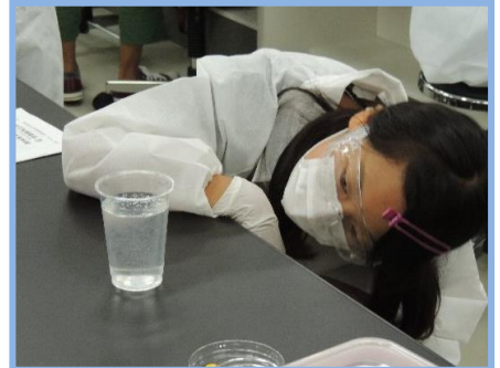
どうなったかな？しっかりと観察を

子どもたちの今と未来のため、社会のあらゆる場で「子ども共育の京都府民憲章」を実践しましょう！