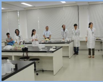
薬科大学の教職員の方々