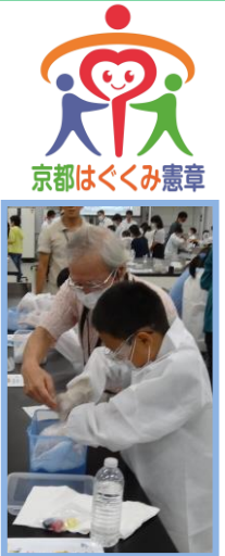
おむつを振って高吸水性ポリマーを取り出そう！