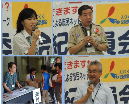
開会にあたっての挨拶や司会、実験の説明・進行をしていただいた山科区『人づくり』ネットワーク実行委員や京都薬科大学の先生方