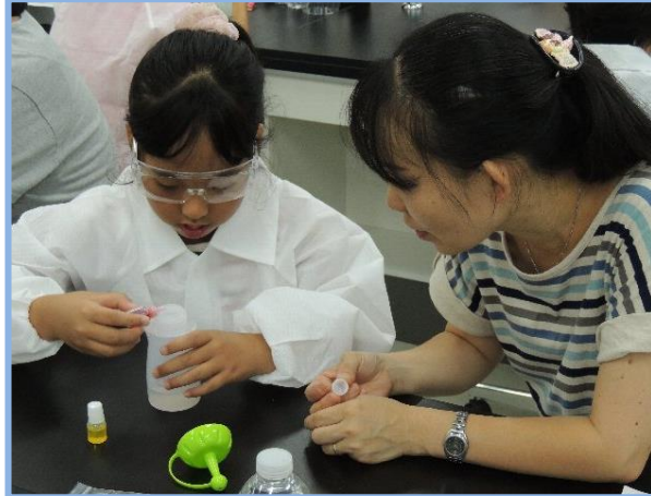
説明を聞いた後真剣なまなざしで実験を行う児童