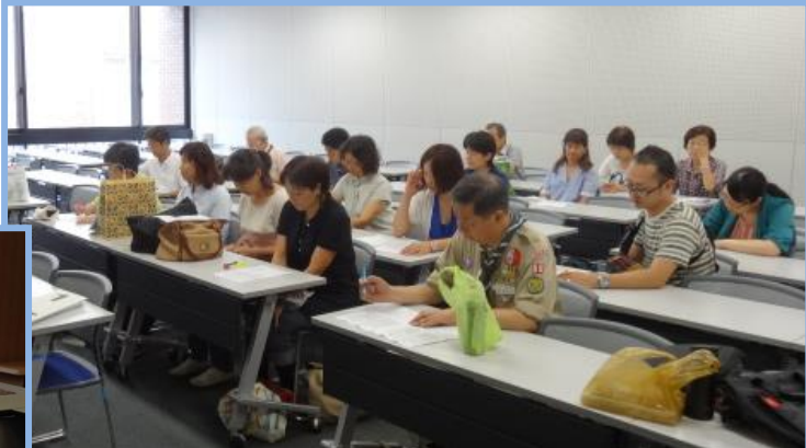
当日朝のスタッフミーティング