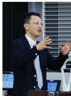
吉川 豊 教授